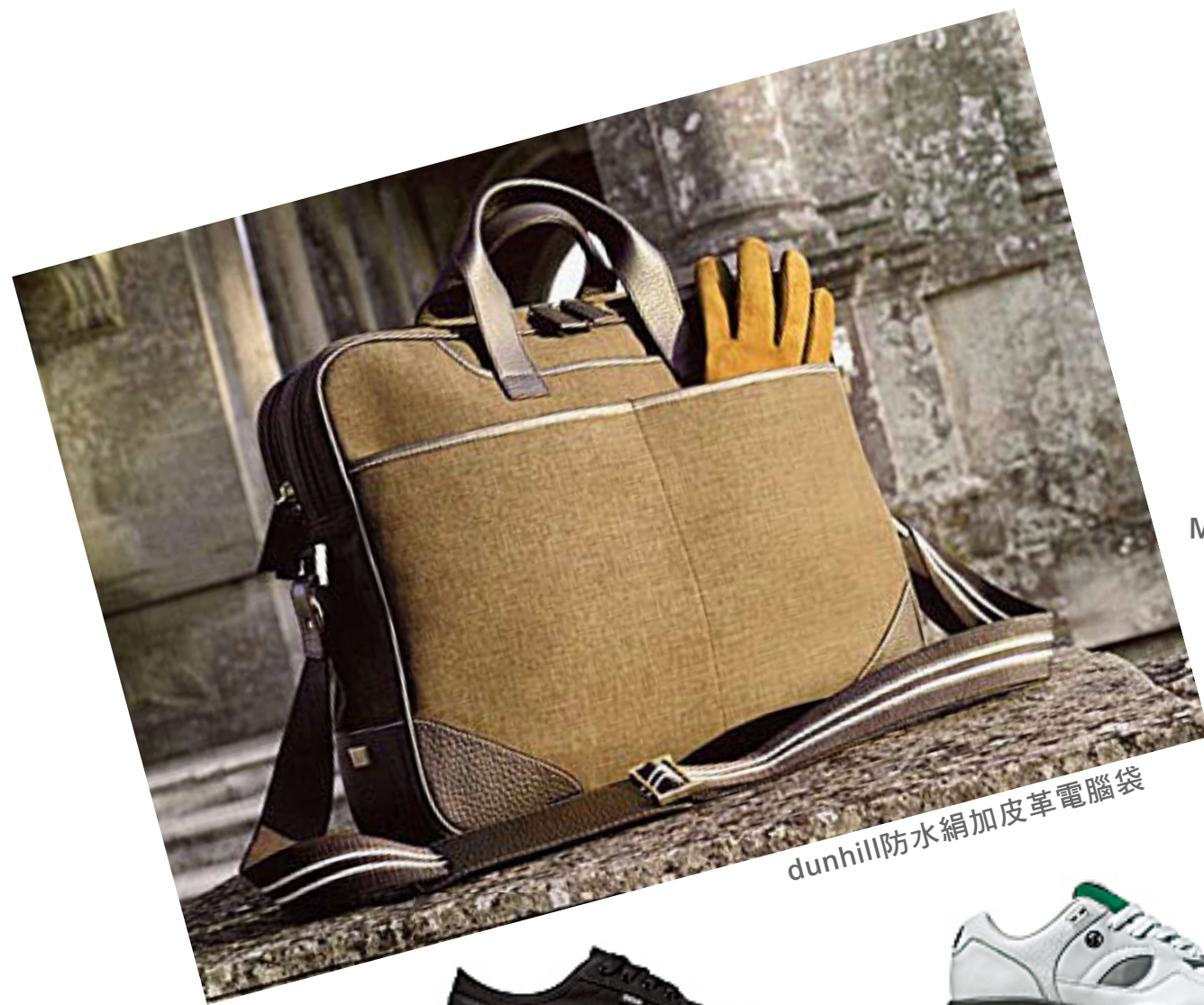
dunhill防水絹加皮革電腦袋