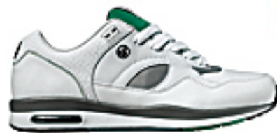
波鞋款還是便鞋款？DVS有選擇。