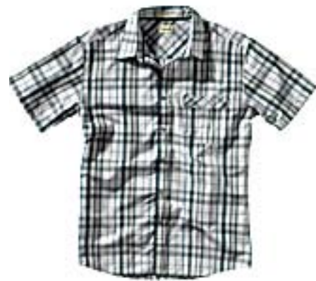
Matix格仔長短袖恤衫，是百搭之物。