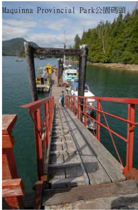
Maquinna Provincial Park公園碼頭