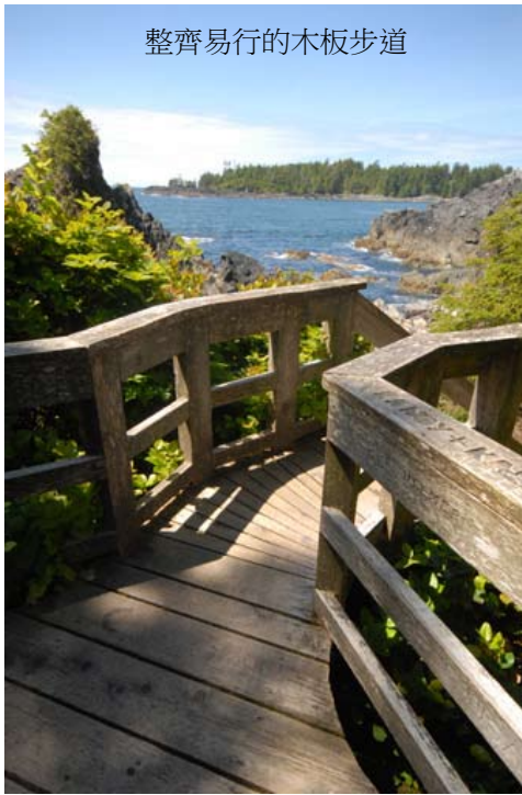
整齊易行的木板步道