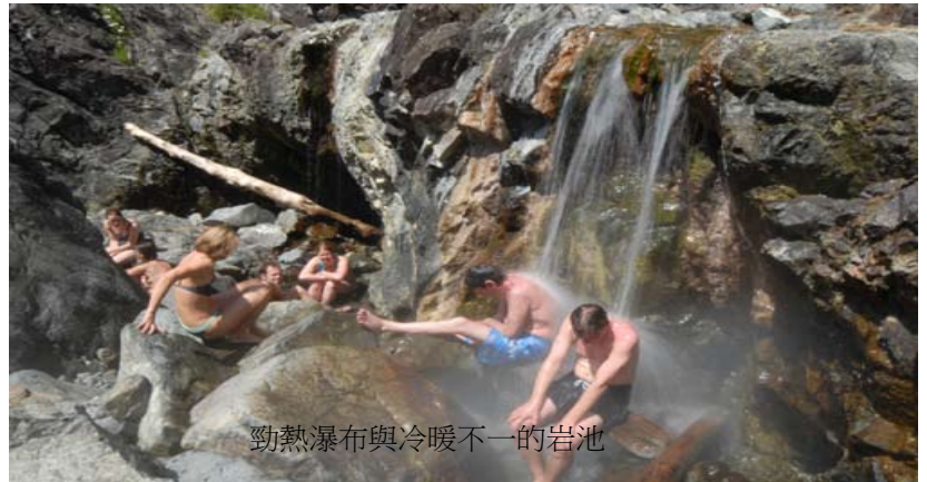
勁熱瀑布與冷暖不一的岩池

這個名為Hot Springs Cove的溫泉其實位於Tofino北邊約37公里的Clayoquet Sound的Maquinna Provincial Park內，大概要花費近100元來回坐船前往。只要與船公司